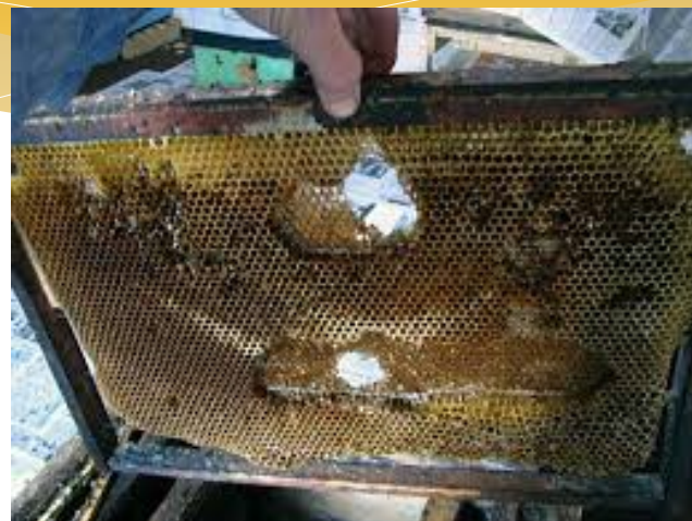
Мышиные ходы в сотах

из-за мышей, из-за болезней, из-за неправильной вентиляции и недостатка или переизбытка влаги.