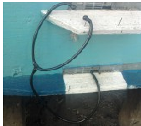
Трубка стетоскопа со снятой мембраной для прослушивания пчёл зимой