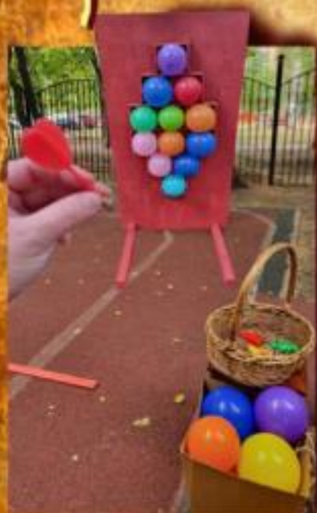
Дартс с шариками