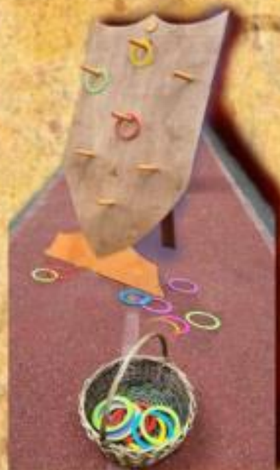
Щит и кольца