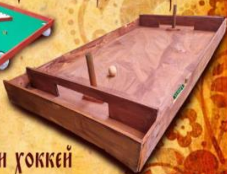
Бильярд и хоккей

Исторические игры из натурального дерева 8000 руб. Цена на группу до 10 человек, за каждого последующего ребёнка + 1000 руб.